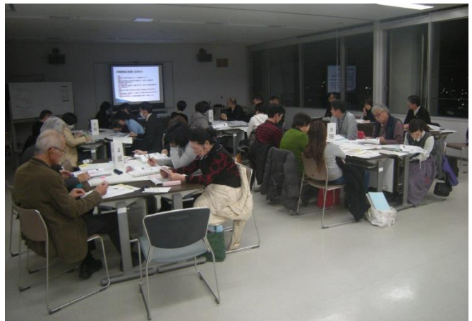
第10回策定委員会の様子

現在、公募市民等による「古賀市自治基本条例（仮称）策定委員会」が中心となって条例に盛り込む内容を検討しています。